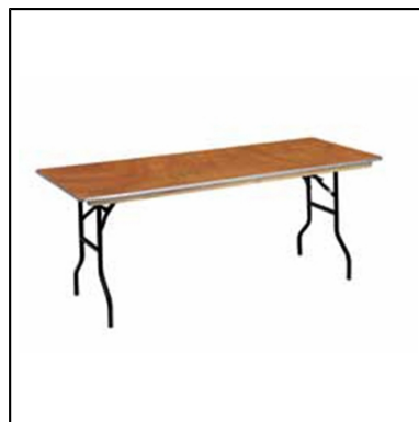
buffet 200x90 H90cm p,pliants bord alu

Réf : 103501 Conditionnement : par 20 Tarif HT unitaire : 34,50 €