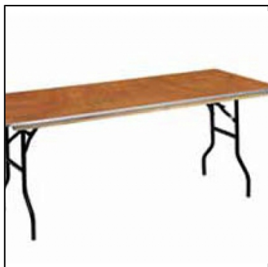
buffet 150x90 H90cm p,pliants bord alu

Cette gamme de buffets pliants s'adapte à tous vos besoins et à tous les formats d'évènement. Pieds pliants, robustes et pratiques - Classement feu M3. Base de buffet roulante adaptée au buffet 200x90.